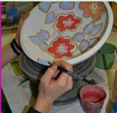
Attività manuali e artigianali