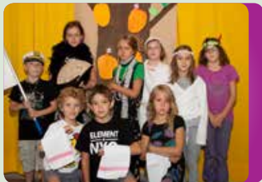
Settimane in montagna