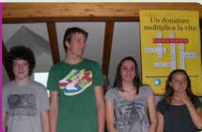
Giornata AIDO a scuola