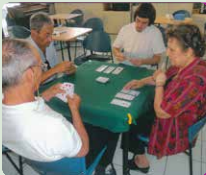
Giochi da tavolo

39100 Bolzano via S. Quirino 34 tel. 0471 283161 antea.bz@virgilio.it