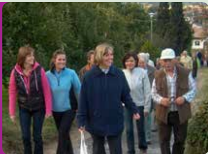
Insieme a passeggio