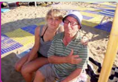
In vacanza insieme