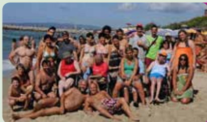
Vacanze al mare

39100 Bolzano via G. Galilei 4/a tel. 335 5452470 www.aadh.it info@aadh.it