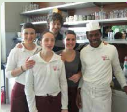
Insieme si fa molto!

39042 Bressanone via Stazione 29 tel. 342 1558844 www.punkt.it info@punkt.it