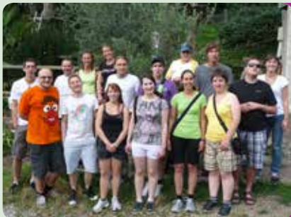
Quanti profumi e suoni nel bosco!

www.blindenzentrum.bz.it katharina.schmidhammer@blindenzentrum.bz.it blindenzentrum.bz.it