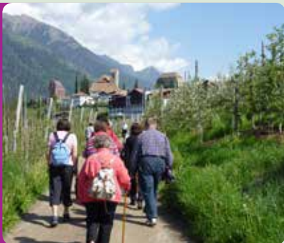
Passeggiata in montagna