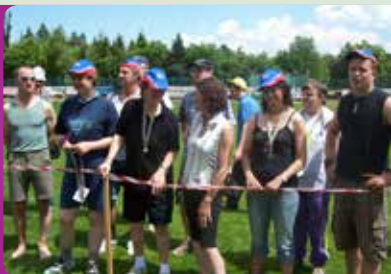
Giornata dello sport