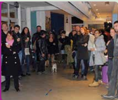
Evento di sensibilizzazione