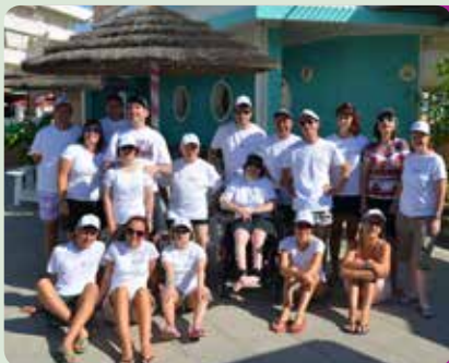
Soggiorno estivo 2012