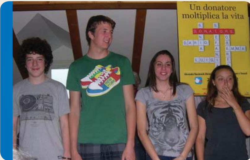
Organspendertag - AIDO in der Schule