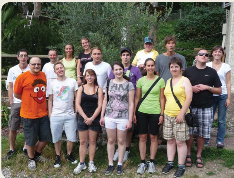
Gerüchen und Geräuschen auf der Spur