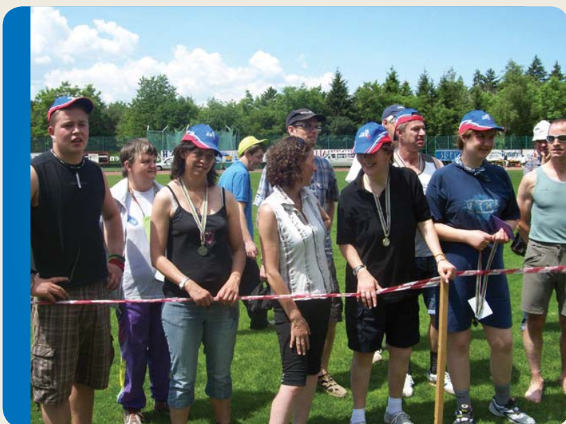
Mitmachen beim Sporttag