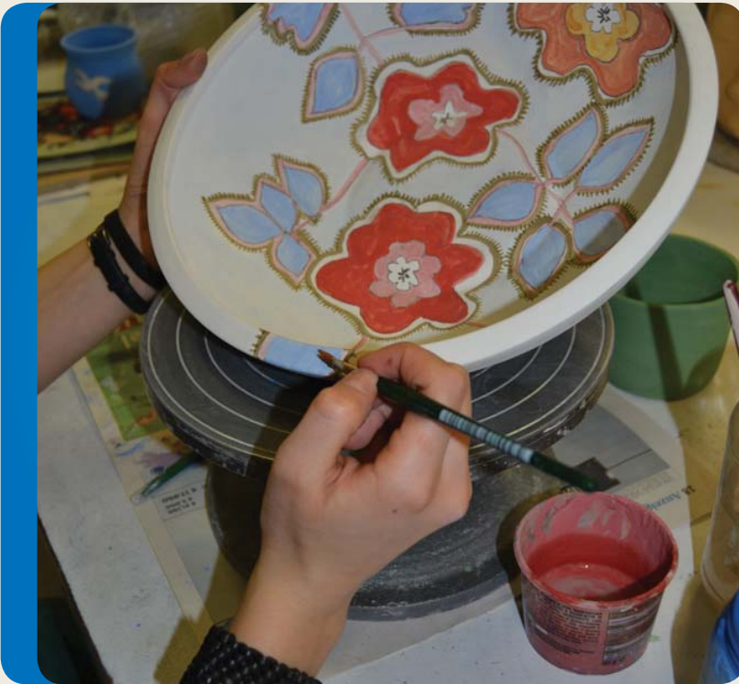
Kunsthandwerkliches Arbeiten beim CIRS