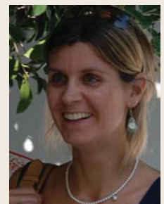
Verantwortliche für Freiwillige

Praktika für Oberschüler/innen und Student/innen Recherchen: Architektonische Barrieren, Integration von Menschen mit Behinderungen