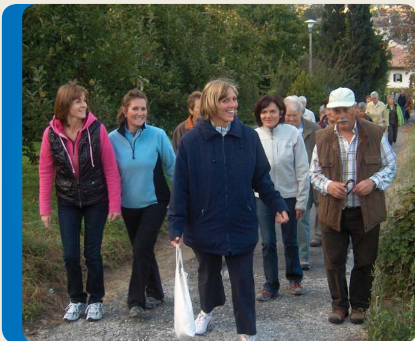
Gesund wandern in Lana