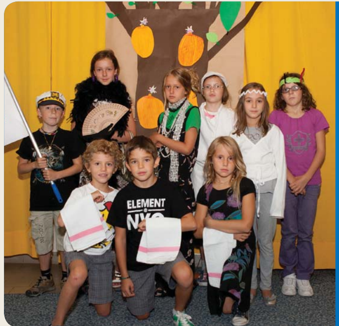
Ferienwoche in den Bergen

39100 Bozen Latemarstraße 8 Tel. 0471 974431 www.ehk.it info@ehk.it