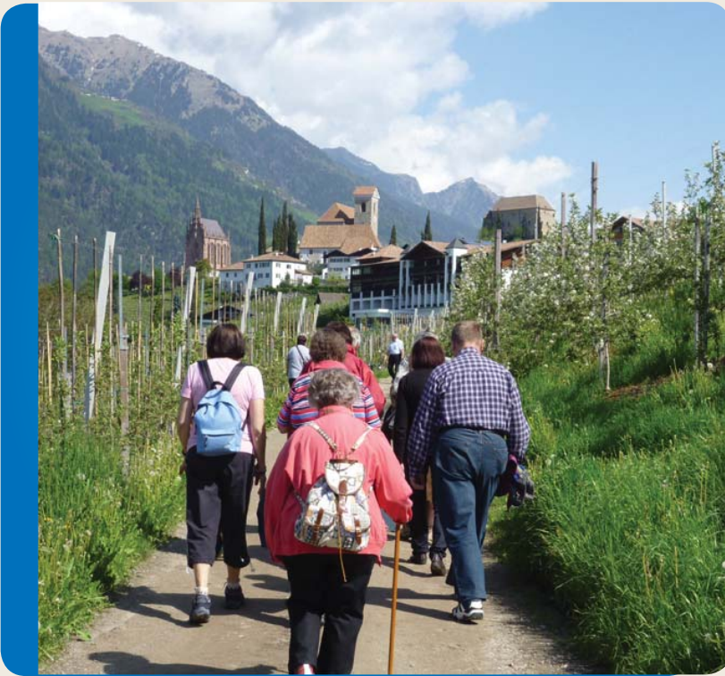
Wanderung in den Bergen