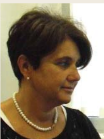
Responsabile per l'accoglienza

Zeitraum: das ganze Jahr über, mit eigener Schulung