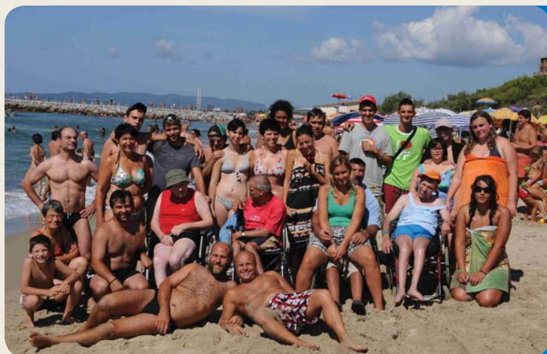
Ferienaufenthalt am Meer

39100 Bozen G. Galileistraße 4/a Tel. 335 5452470 www.aadh.it info@aadh.it