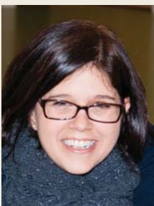
Verantwortliche für Freiwillige

Zeitraum: das ganze Jahr über, vorwiegend aber in den Sommermonaten