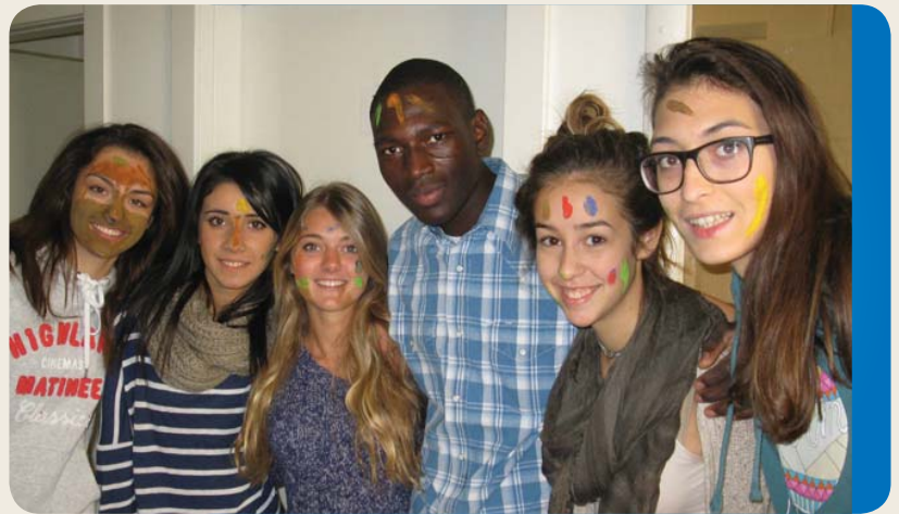
Ein gemeinsames Fest