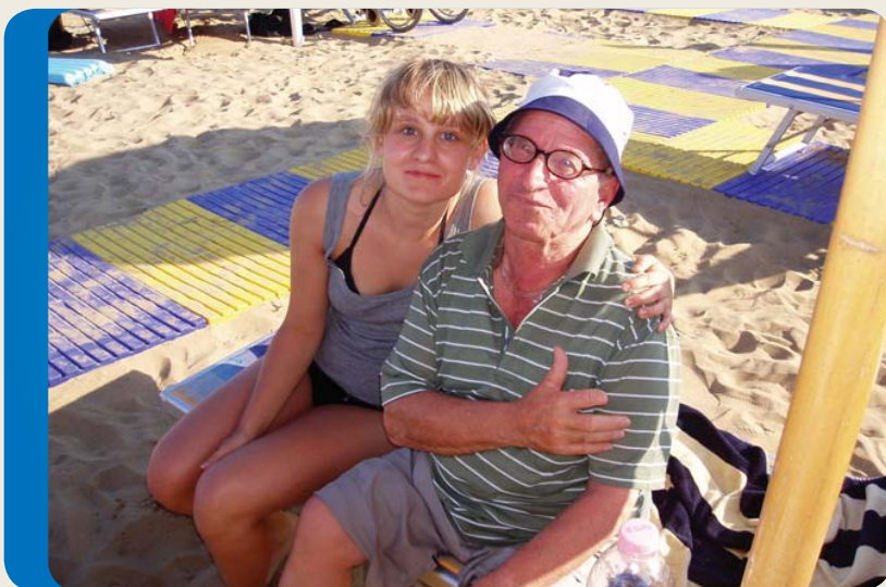
In vacanza insieme