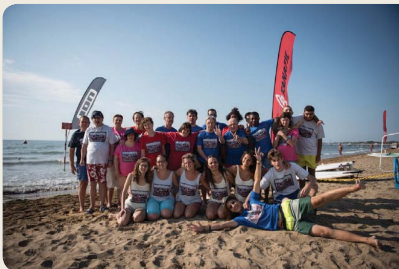
Soggiorno estivo 2015

39100 Bolzano via Piacenza 29a tel. 0471 204476 www.aiasbolzano.it fb: aias bolzano twitter: @ondaaias instagram: aias bolzano