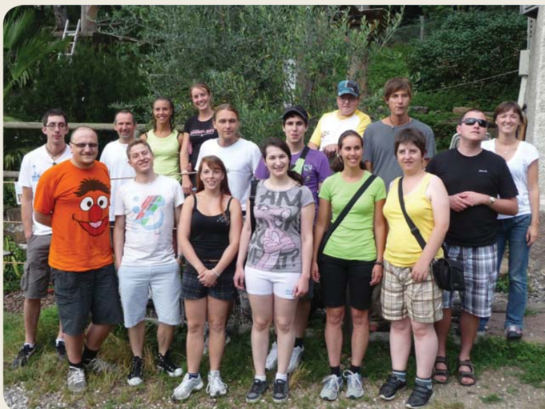
Quanti profumi e suoni nel bosco!

39100 Bolzano vicolo Bersaglio 36 tel. 0471 442323 www.blindenzentrum.bz.it katharina.schmidhammer@blindenzentrum.bz.it