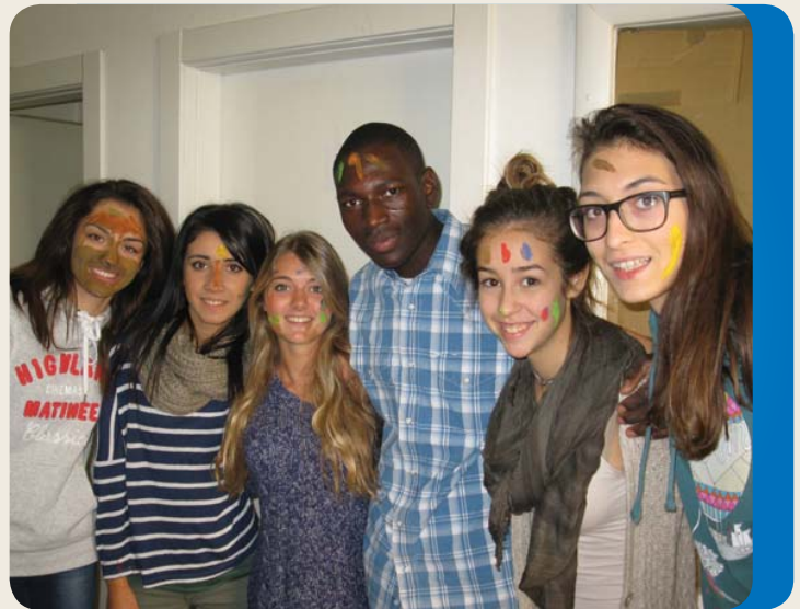
Una festa insieme