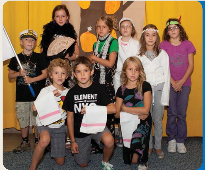
Settimane in montagna

39100 Bolzano via Latemar 8 tel. 0471 974431 www.ehk.it info@ehk.it