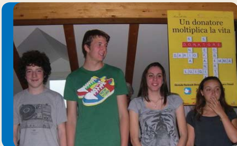
Giornata AIDO a scuola