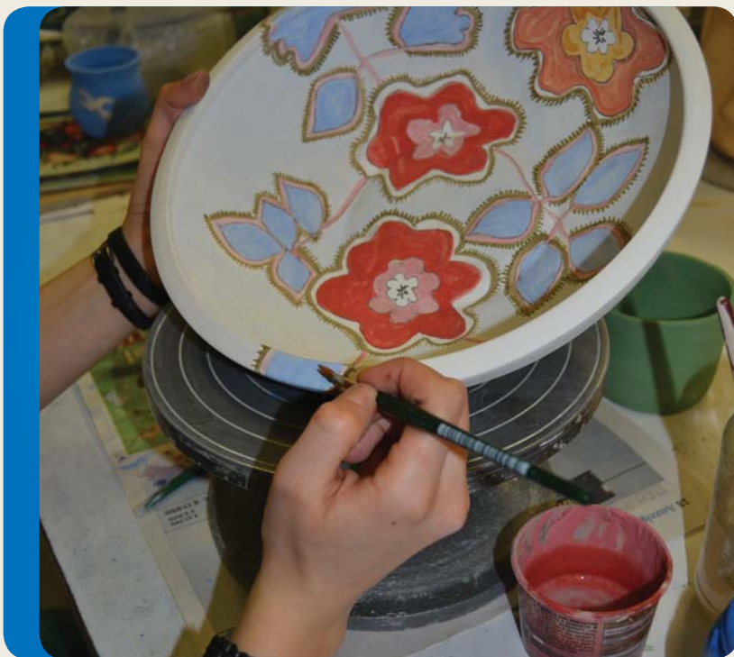
Attività manuali e artigianali