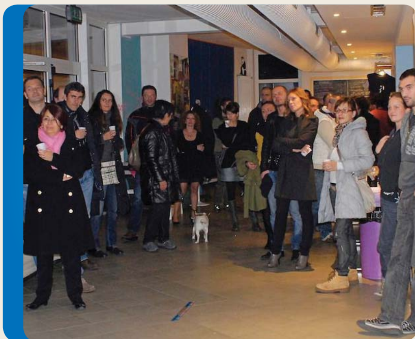
Evento di sensibilizzazione