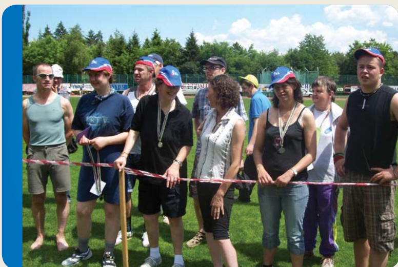
Giornata dello sport