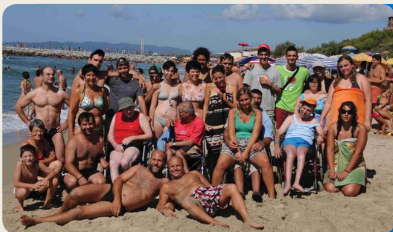
Vacanze al mare

39100 Bolzano via G. Galilei 4/a tel. 335 5452470 www.aadh.it info@aadh.it