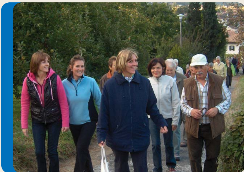
Insieme a passeggio