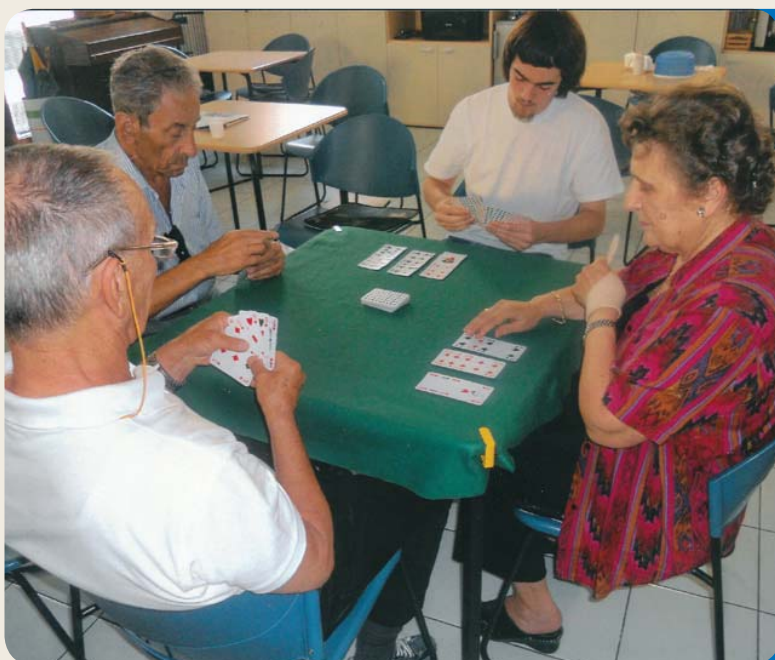
Giochi da tavolo

39100 Bolzano via S. Quirino 34 tel. 0471 283161 antea.bz@virgilio.it