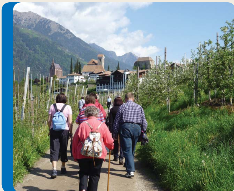
Passeggiata in montagna