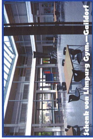
Schenk von Limpurg Gymnasium—Gaildorf

In che periodo dell'anno si svolge il progetto?