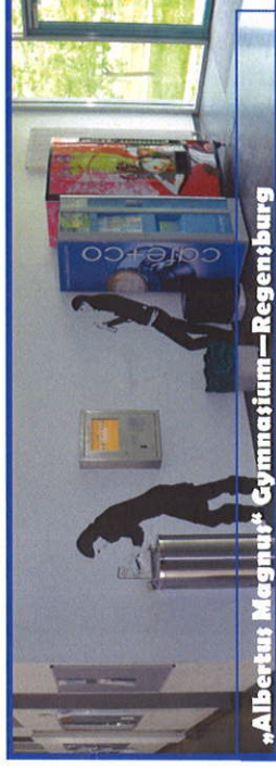
Albertus Magnus Gymnasium—Regensburg